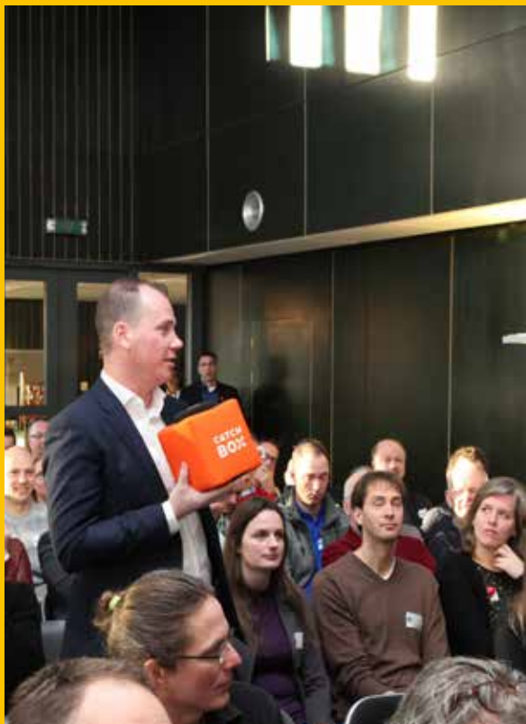
Lancering i-Tree Nederland, februari 2019.

In 2019 droeg Stadswerk op verschillende manieren bij aan de kwaliteit van de fysieke leefomgeving. Met Stadswerk magazine, een special over Connectiviteit, mogelijkheden tot kennisuitwisseling via 90 bijeenkomsten, een goed gewaardeerde studiereis naar Zürich en verschillende kennisproducten. Maar ook als penvoerder van verschillende onderzoeken en kartrekker en verbinder binnen onder andere het Oogstfonds, de Community of Practice Duurzaam GWW, i-Tree en het Kennis- en Ervaringsplatform Invasieve Exoten i.o.. Steeds met maar één doel: een platform bieden waar onze leden van elkaar leren hoe het kán. Samen werken aan een openbare ruimte waar we trots op kunnen zijn. En die antwoorden biedt op grote maatschappelijke vraagstukken van deze tijd. In 2019 organiseerden we, met VHG, een tweede Future Green City College tour en, voor het eerst, de Nederlandse Boominfodag. Daarnaast hebben we ons stevig voorbereid op het jubileumjaar 2020 en kwam het thema Druk(te) op de openbare ruimte, via onze actieve leden, prominent in beeld.