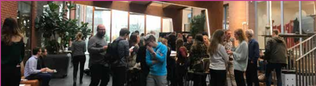
Future Green City college tour, oktober 2019.

In 2019 was Stadswerk vertegenwoordigd in 29 commissies en adviesraden. Stadswerk heeft zitting in de jury voor de MKB Infra Award. Daarnaast heeft Stadswerk zich op diverse bijeenkomsten gepresenteerd, zoals de Zuid Nederlandse Groendagen, de Nationale Groendag, de Dag van de Omgevingswet en de Vakbeurs Openbare ruimte.