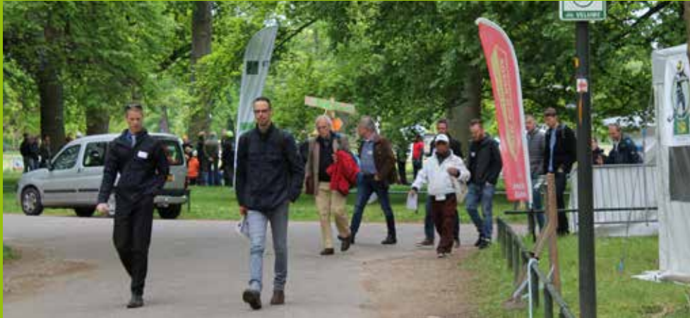
Boominfodag, mei 2019.

8,8 als gemiddeld rapportcijfer, de best gewaardeerde bijeenkomst, gevolgd door de Praktijk-excursie Gebiedsontwikkeling Binckhorst in Den Haag (8,7). Ook de studiereis naar 'Resilient' Zürich werd met een 8,3 weer prima gewaardeerd.