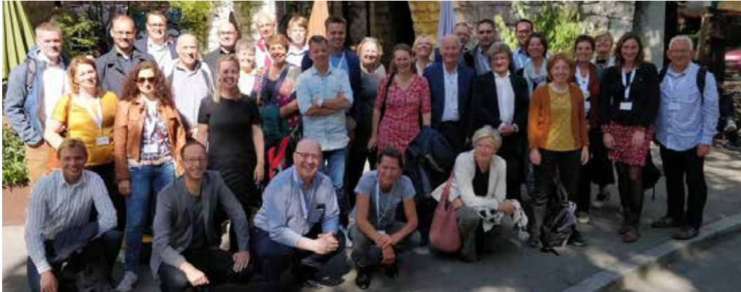
studiereis Zürich, september 2019.

Ook de groene stadsexcursie naar Antwerpen, die we samen met onze Vlaamse zusterorganisatie VVOG organiseerden, kon op dezelfde hoge waardering rekenen. Ook voor deze reis hebben we, met een korting, het reizen met Openbaar Vervoer gestimuleerd. In 2020 ontvangen we, in het kader van ons jubileumjaar, zowel een Belgische als een tweede buitenlandse delegatie.