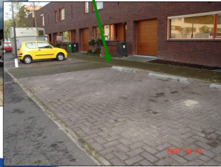
Goed: goed bereikbaar