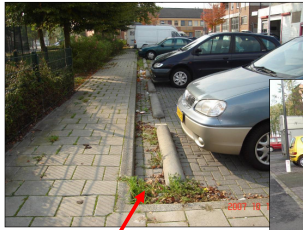
Fout: slecht bereikbaar